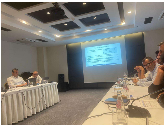
Hartimi i Strategjisë për Zhvillim Industrial dhe Mbështetje të Biznesit 2030, MINT

Në kuadër të projektit për hartimin e Strategjisë për Zhvillim Industrial dhe Mbështetje të Biznesit 2030, organizuar nga Ministria e Industrisë, Ndërmarrësisë dhe Tregtisë, Drejtori i IFIN ishte pjesëmarrës në këtë panel diskutime, ku u paraqitën propozime dhe ide konkrete sa i përket fushës së inxhinierisë së ndërtimit si pjesë e zhvillimit industrial në Republikën e Kosovës.