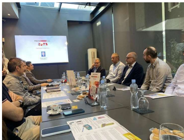
Pjesëmarrja në punëtorinë e Prota Softëare në Shkup

Me ftesë nga Oda Ekonomike Gjermano-Kosovare, përfaqesuesit e IFIN morrën pjesë në Forumin Ekonomik organizuar nga kjo Odë, në periudhën 2 deri 3 Tetor 2024, ku u zhvilluan takime biletale me personalitetet pjesëmarrëse, me qëllim inicimin apo vazhdimin e bashkëpunimeve me sektorin privat dhe institucional.