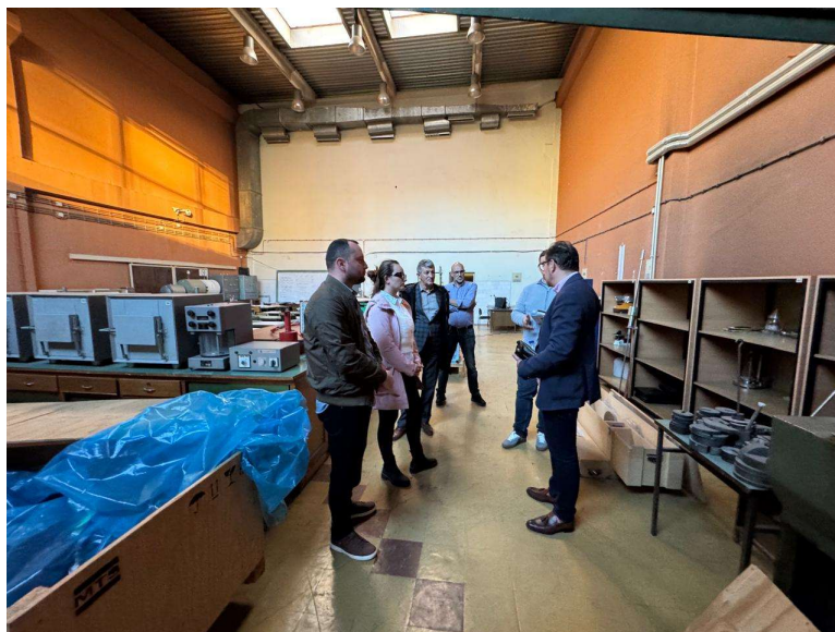
Vizita nga stafi akademik i Fakultetit të Inxhinierisë së Ndërtimit të Universitetit Kiril dhe Metodij në ambientet e IFIN

paisjeve laboratorike që i posedon IFIN në kuadër të Fakultetit, si mundësi për bashkëpunime të mëtutjeshme ndërmjet dy institucioneve me qëllim përfshirjen në projekte hulumtuese ndërkombëtare.