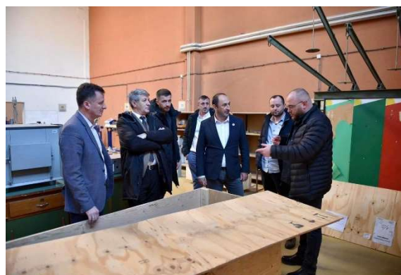
Takimi i Menaxhmentit të FIN dhe IFIN me Ministrin e MMPHI-së