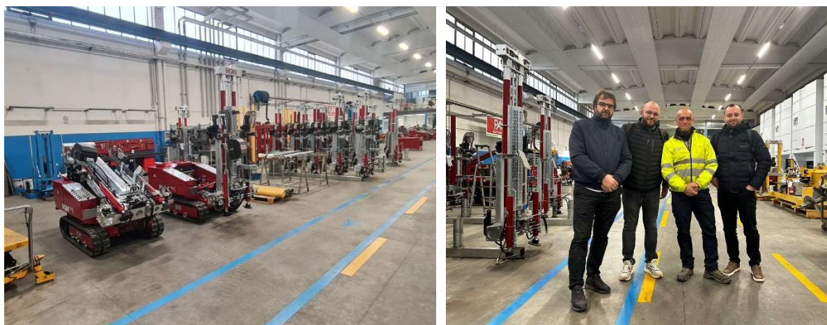
Trajnimi për përdorimin e paisjes gjeomekanike CPT, Pagani Company, Milano, Itali

Gjatë vitit 2024, ka filluar procesi i funksionalizimit të disa paisjeve ekzistuese në laboratorët e Fakultetit të Inxhinierisë së Ndërtimit, si dhe furnizimi me paisje të reja laboratorike, konform kërkesave nga departamentet e Fakultetit të Inxhinierisë së Ndërtimit. Këto furnizime arrijnë vlerën prej 600,000.00 euro. Pajisjet kanë filluar të lifterohen dhe kontrata parashikon përfundimin e procesit deri në korrik të vitit 2026. Në kuadër të kësaj kontrate, Drejtori i Institutit, Sekretari dhe Shefi i Departamentit të Konstruksioneve, kanë marrë pjesë në një trajnim njëjavor për njëri nga pajisjet (CPT-Pagani, laborator i Gjeomekanikës) në Milano, Itali, me çrast janë pajisur me certifikata përdorimi të kësaj paisje nga ky trajnim.