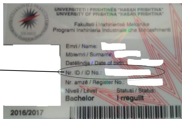
Fig. 1. Qasja në aplikacion.

Në fushën PËRDORUESI duhet të shënohet numri i ID kartelës së studentit përkatës. Ndërsa tek fusha FJALËKALIMI shënohet fjalëkalimi i studentit i cili për herë të parë është: Numri personal i studentit . Pasi të qaseni ju duhet ta ndryshoni fjalëkalimin tuaj si në figurën me poshte dhe të klikoni butonin Dërgo Fig.2