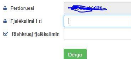
Fig. 2. Ndryshimi i fjalëkalimit.