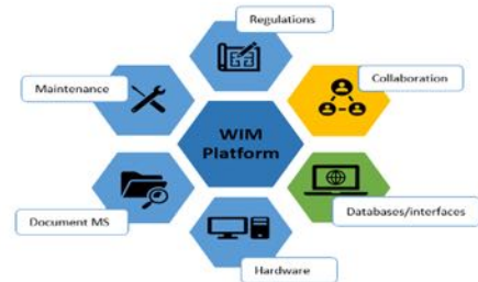
Figura: Arkitektura konceptuale e së ardhmes/SIU e përmirësuar siç parashikohet nga Programi

Udhërrëfyesi synon të shërbejë si një dokument udhëzues, duke identifikuar hapat kyç për zbatimin, ndërtimin e aftësive dhe vendosjen e aranzhimeve të qeverisjes për zhvillimin e mëtejshëm të SIU.